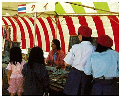
世界各国の様々な輸入品が並んでいました。