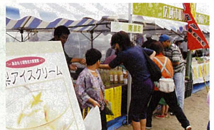
広域市町村物産展ではいちご煮やせんべい汁、手作りアイスなどの地元の味を販売。