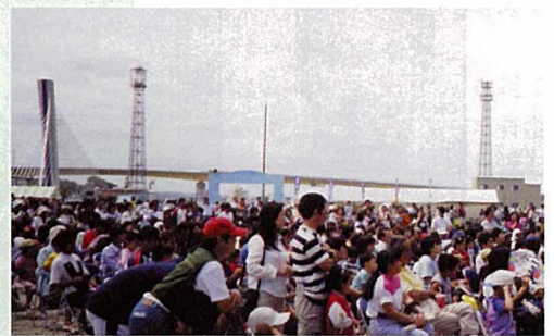
こんなにも多くの方がワールドステージに集まりました。