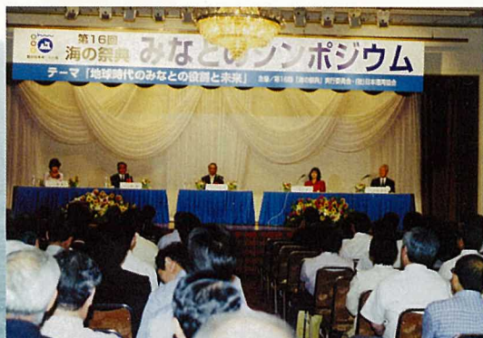
第3部 パネルディスカッション