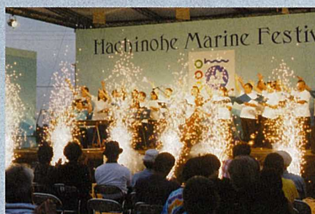
県民の歌「青い森のメッセージ」とともに閉幕