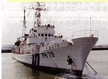
人気の高かった巡視船「あぶくま」の体験航海。