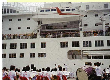
大勢の市民が見送る中、横浜への八戸市民クルーズに出航する客船「ふじ丸」。