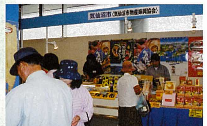
三陸海の観光物産展コーナー。気仙沼市のフカヒレスープはあっという間に完売。