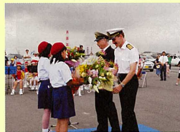
海洋少年団から両船長に花束贈呈。