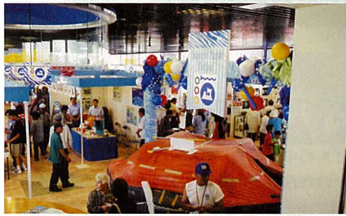
八戸港海事官公署PRブースでは、子供たちが港や貿易などについて学びました。