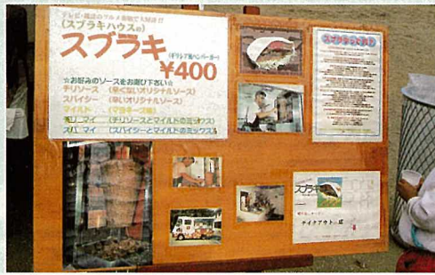
エジプト料理やギリシア料理(スプラキ)などが非常に人気がありました。