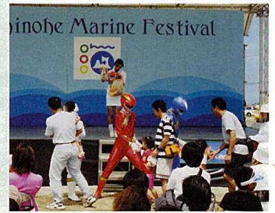
子供に大人気のキャラクターショー。ヒーローとの握手会には長蛇の列が…。