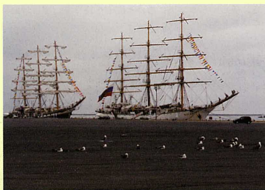
ポートアイランドに寄港するロシア帆船。左からパラダ、ナジェジュダ。外国船籍の帆船が2隻同時に寄港するのは大変珍しい光景です。