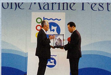
青森県から次期開催県である石川県へバトンタッチ

記念品の贈呈が行なわれた後、青森県「えんぶり」、石川県「七尾まだら」の郷土芸能が披露され、10日間に渡って開催された第16回「海の祭典」あおもり2001を締めくくりました。