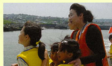
約80人が監督測量船「ほくと」に乗船し、1時間かけて港を見学。乗船した子供たちは船からの景色におおはしゃぎ。