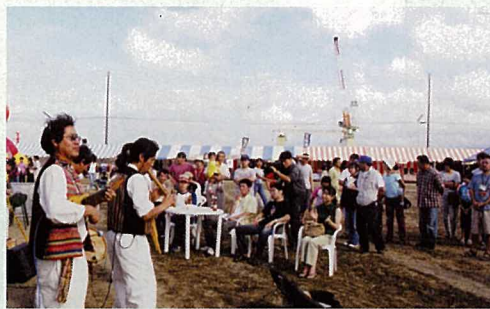
ペルーの民族音楽フォルクローレには、多くの来場者が聞き入っていました。異文化との交流の窓口。これこそまさに港の姿ですね。