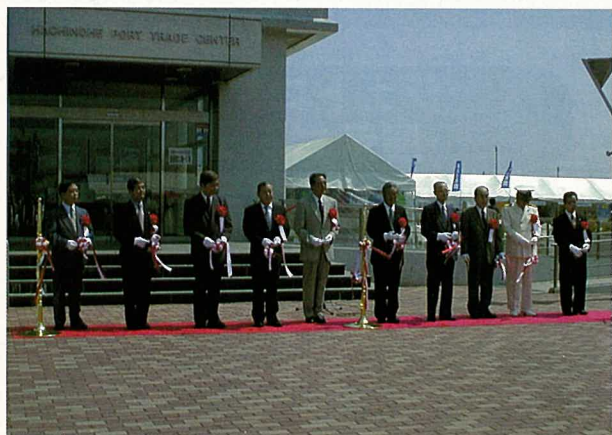
オープニングセレモニーにおけるテープカット

国土交通省監督測量船「ほくと」や海上保安庁巡視船「しもきた」の体験航海、定期コンテナ航路を開設している東南アジア諸国や北米などの輸入品展示即売、世界のグルメコーナー、フリーマーケットなど多彩なイベントを通して、輸入促進のPR、港湾・海の普及活動が行われました。親子連れなど二日間でおよそ一万人の来場者があり、大盛況に終わりました。