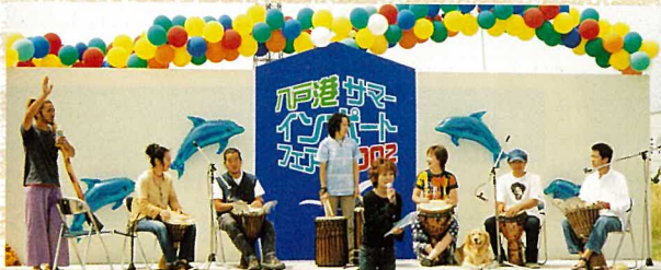
BON アフリカ ジャンベ

軽妙なジャズや、不思議なアフリカ音楽が流れる中、ビール片手に見物客は楽しんでいました。