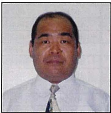
(株)アンデス・アイオニクス