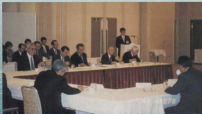
審議中の役員と事務局