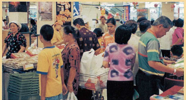
タイ物産展の様子

※左記事業は、社団法人青森県物産協会が事業主体として実施し、県が補助する等連携して実施するものです。