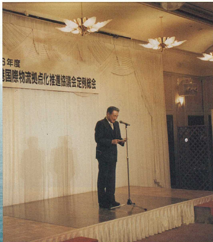
協議会会長あいさつ

今年度も八戸港の利用拡大と貿易の一層の促進を目指し積極的な活動を行って参ります。