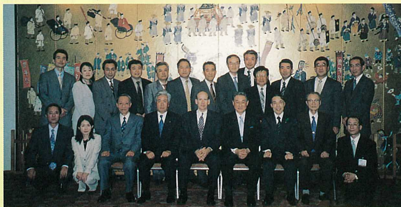
参加者の記念撮影 ホテル内にて

この夕食会を機に、両地域の交流が益々盛んになり、北米航路の発展につながることが期待されます。