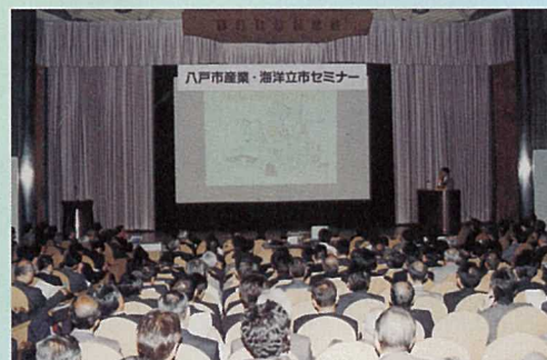
昨年のセミナーの様子

ご出席いただいた皆様との交流の場をご用意しております。 立食形式（無料）となっておりますので、お気軽にご参加ください。