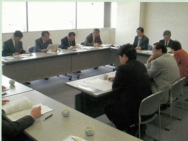
仙台市議会議員視察

その後、八戸港貿易センタービルにおいて八戸港の貿易概況や定期コンテナ航路、八戸港貿易センターの業務概要などの説明が行われました。その後は仙台塩釜港の現状も含め、FAZ指定地域の今後の展望などについて活発な意見交換を行いました。