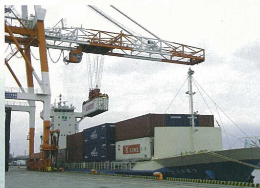
内航船 「つるかぶと丸」