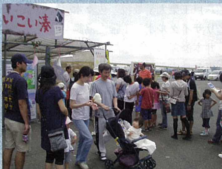
エコわた飴ブース