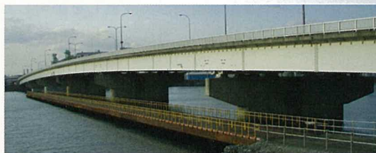
八太郎大橋と工専用仮橋

八太郎大橋は昭和55年に完成した、馬淵川の一番下流にかかるとる長さ421mの橋で、港湾貨物の輸送に重要な役割をはたしています。