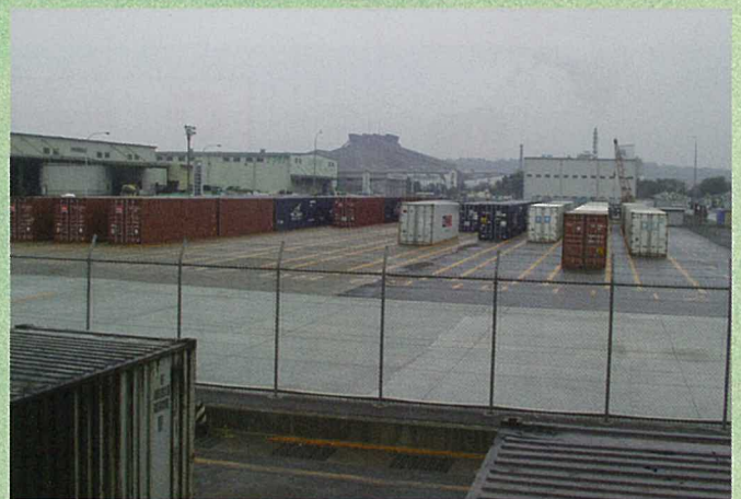
手前フェンスの奥が拡張部分

拡張部分は主に空コンテナの置場として活用し、荷捌きをより迅速に効率よく行えるようにすることで、今後の貨物量の増加につながることを期待されます。