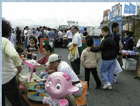
来場者でにぎわう会場

会場には暗くなるまで多くの来場者が訪れ、港を中心とした八戸の魅力を感じてもらい、盛況のうちに終ることができました。