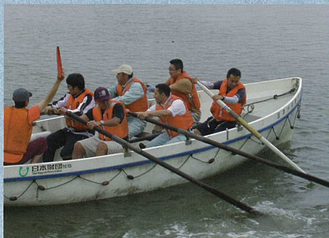
力いっぱいオールを漕ぐ参加者

当日は小雨が降り続くあいにくの空模様となりましたが、多くの参加者が力いっぱいレースを楽しんだことで、これからも海を身近に感じてもらうイベントとして定着していくことを期待しています。