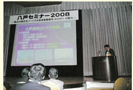
八戸港紹介(青森県 大平GL)