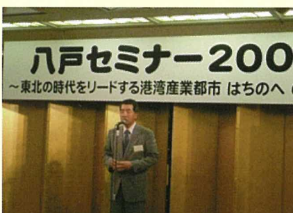
八戸港振興協会 大矢会長による乾杯