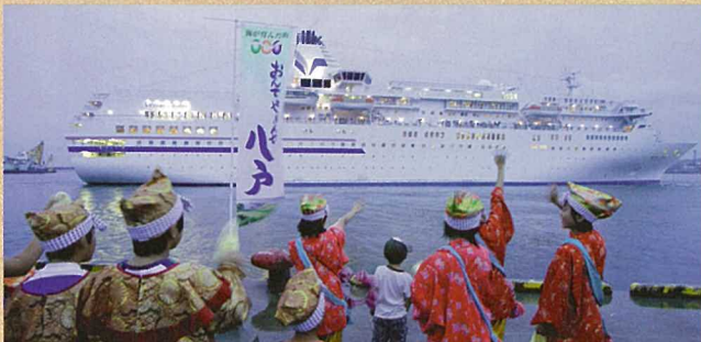
出港を見送る子供たち

1998年にデビューし、全長183.4m、全幅25m、総トン数26,561トンと国内のクルーズ船では、2番目の大きさとなっています。238の客室に加えレストラン・ラウンジやスポーツ・リラクゼーション施設が充実しています。