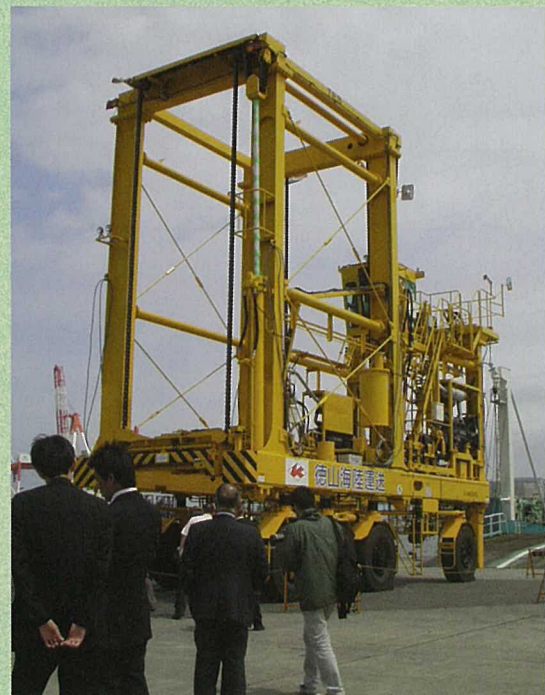
出荷されるストラドルキャリア

八戸港のコンテナヤードでも活躍しているストラドルキャリアですが、地元での製造は初めてのことであり、今後の地元製造業界の活性化が期待されます。