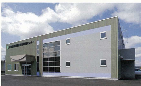
衛生検査センター

青森県薬剤師会は、薬剤師の倫理的及び学術的水準を高め、公衆衛生と社会福祉の向上を目的にしており、各種研修等の開催、医療連携の推進・強化等に取り組んでいます。その事業の一環として、昭和54年11月に衛生検査センターが青森市に設立されました。検査項目は、飲料水等の水質検査を皮切りとして、食品検査、食品衛生管理、医薬品検査、臨床検査、大気検査、土壌検査など、対応分野を広げてきました。平成16年には、八戸支所を開設して輸出入手続きの窓口を拡充し、青森県南のみならず岩手県北地域の窓口としても利用が広がっています。平成21年4月に青森中核工業団地内に新築移転し、規模は旧施設の3倍以上となり、最新の検査機器を整備して、より高い検査精度で信頼される検査機関を目指し、活動しています。