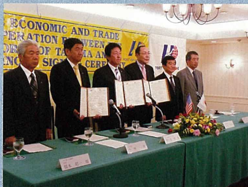
調印後の記念撮影

今回の経済貿易協定の延長を機に、両港の友好関係がさらに深まることと期待しています。