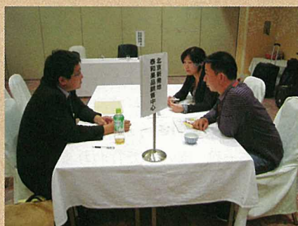
中国人バイヤーとの商談