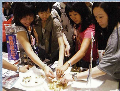
来場者に好評な水産加工品