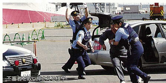
不審者を取り押さえる様子 青森県三八地域県民局 地域整備部 八戸港管理所 TEL:0178-28-2105 FAX:0178-20-4746

八戸港で実施された「テロ対策訓練」についてご紹介します。 八戸港保安委員会及び八戸港危機管理コアメンバーは、9月10日、ポートアイランドにおいて、八戸港埠頭・水域保安及びテロ対策訓練を実施しました。この訓練は、「国際航海船舶及び国際港湾施設の保安の確保等に関する法律」に基づき、テロなどの危害行為を防止するため、平成16年度から実施しています。 当日は、八戸海上保安部や八戸警察署など26機関から約100人が参加したほか、船舶5隻が参加しました。 陸上では、河原木1号埠頭のゲートで出入管理する保安要員が、不審者を発見し関係各機関へ通報するとの想定から始まり、通報により駆けつけた八戸警察署員が不審者を取り押さえるなどの訓練を実施しました。また、海上では不審船を海上保安部の巡視艇及び青森県警察本部の警備艇が、追跡、補足する訓練を実施しました。 今後も、八戸港を安心してご利用いただけますよう、保安の向上と危機管理体制の強化を図っていきます。