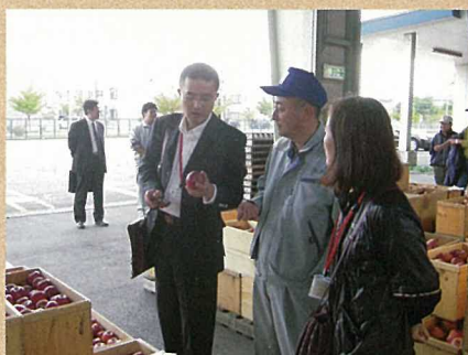
弘果弘前中央青果の視察

今回のような国内商社が参加した中国人バイヤーとのマッチングは初めての試みでしたが、国内商社からは、「中国人バイヤーから具体的な情報を開けたのはいい機会だった」との声が多く、今後の輸出拡大に向けて貴重な情報交換の場となりました。