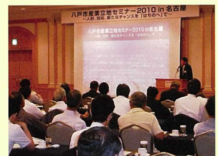
会場の様子(名古屋)