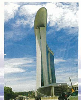
マリーナベイ・サンズ

そして日本食ブーム。こちらのデパートで日本食の物産展が開催されるたびに大混雑しています。沖縄、四国、九州、北海道等、日本食がブームになってきているのを実感します。日本より価格が割高でも飛ぶように売れているのです。早く八戸のせんべい汁も来ないかな?とひそかに期待してしまいます。