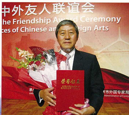
授与式典に参加した泉山会長