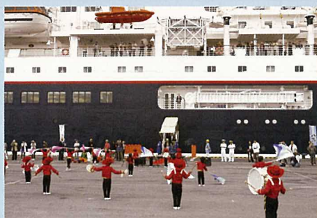
保育園児による歓迎の演奏