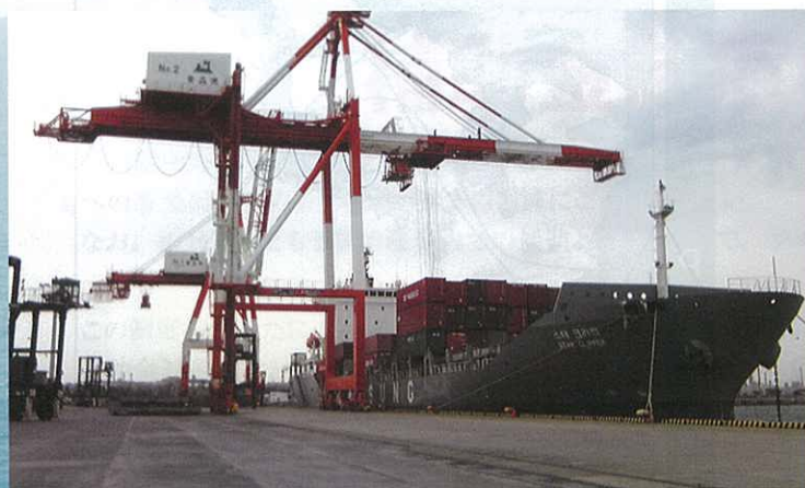
南星海運(株)のコンテナ船「Star Clipper」