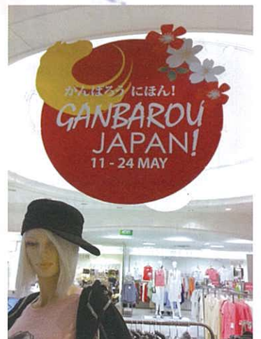
日系デパートでの「がんばろう日本フェア」

この問題は日本国内だけでなく多くの国に影響をもたらしています。早く終息に向かってほしいと願います。