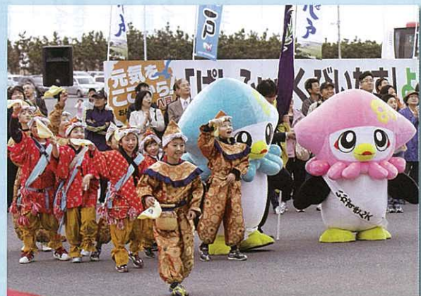
出港時、別れを惜しんで手を振る子どもたち