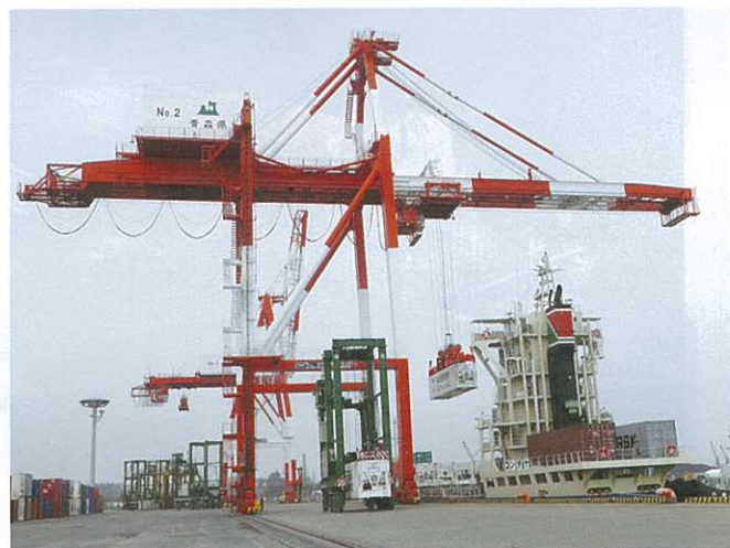
井本商運(株)コンテナ船「まいこ」