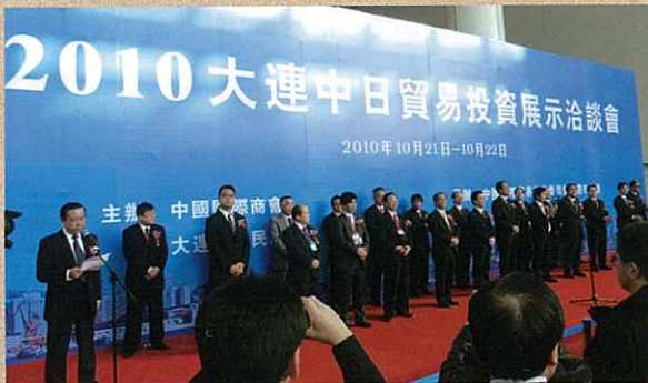
「2010大連中日貿易投資展示商談会」開会式の様子

さらに、大連市にビジネスサポートセンター、上海市と香港にコーディネーターを置いて、県内企業の現地ビジネス活動の支援を行うとともに、県内においても、海外ビジネスに関するセミナー、個別相談会を随時開催するなど、幅広いメニューにより県内企業による県産品輸出などの海外ビジネスの取組を支援しています。