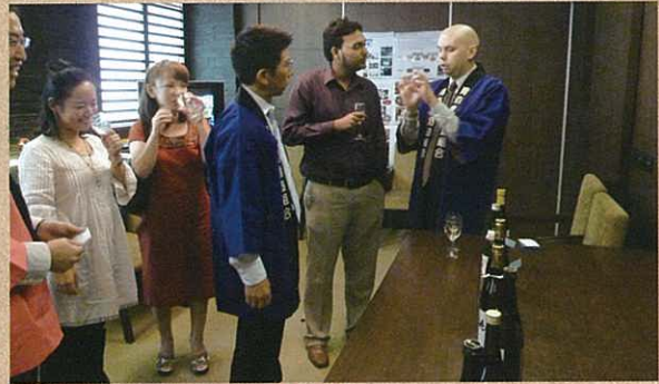
インドでの日本酒試飲の様子