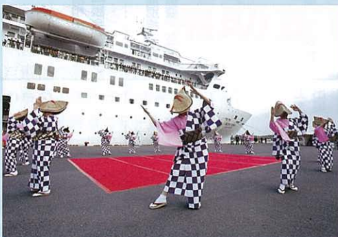
出港イベントでの南部手踊り披露