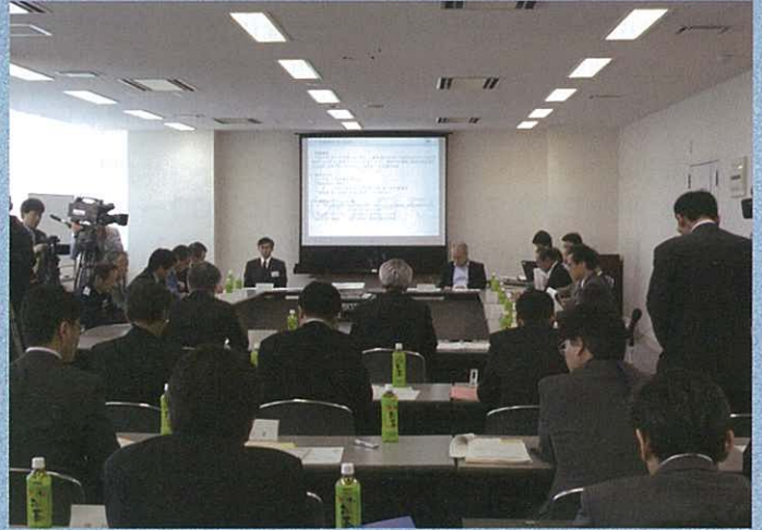
第1回 八戸港復興会議の様子

八戸港復興会議は、計3回開催し、7月末までに「八戸港復旧・復興方針」を策定する予定です。