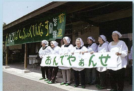
山の楽校でのお出迎え