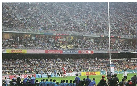
香港セブンズラグビー