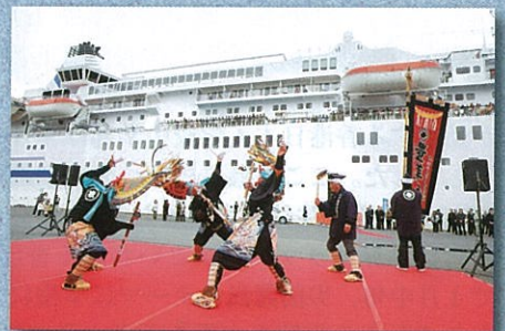
出港イベントでの八戸えんぶり披露