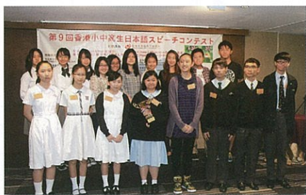
日本語スピーチコンテスト