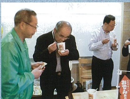
ご当地グルメ試食会の様子

協議会ではこれからも、県内企業や関係機関と連携を取りながら、海外販路拡大に向けて取り組んで参りたいと考えております。