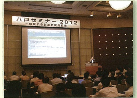
昨年度東京会場の様子