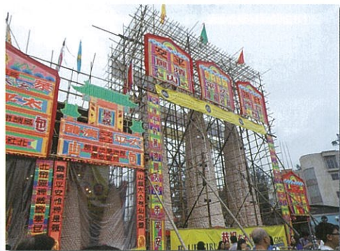
長州島の饅頭祭り