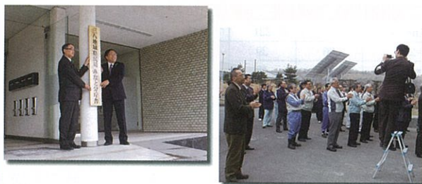
青森県三八地域県民局 地域整備部 八戸港管理所 TEL:0178-21-2280 FAX:0178-21-2370

開所式当日は、関係団体の皆様も集まり、震災復興のシンボルとしての開所を祝いました。