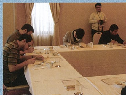
評価シートに記入する参加者