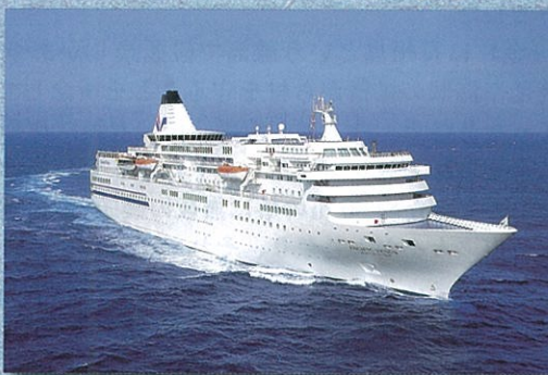
ぱしふいっくびいなす