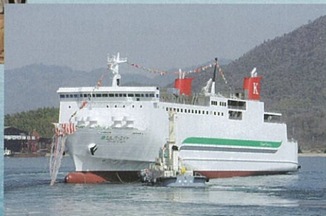
シルバーエイト進水式の様子