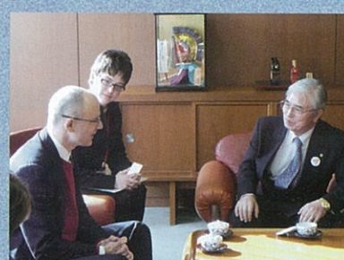
八戸商工会議所訪問