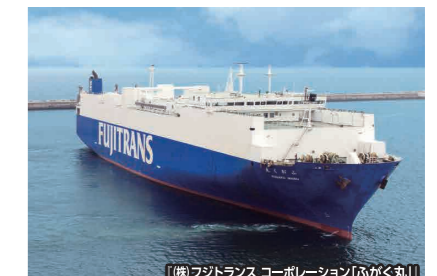
【(株)フジトランス コーポレーション】

川崎と名古屋の2つの航路があり、完成自動車輸送のほか、貨物を積んだトラックやシャーシなどを運んでいます。*RO/RO船・・・(Roll on Roll off ship:ローロー船)岸壁と船の間を橋で結び、貨物を搭載した車両が船倉内に入ることによって貨物の積み下ろしができる船のこと。