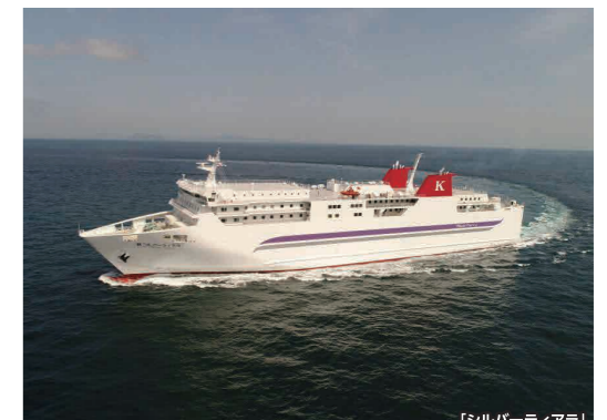
【シルバーティアラ】